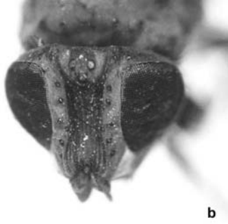
Dişide başın önden görünüşü