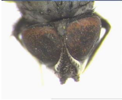
Erkek başın önden görünüşü