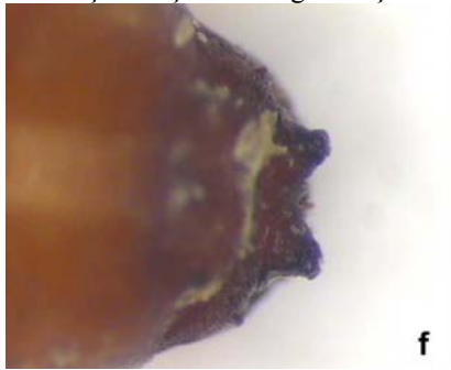
Pupada son segment